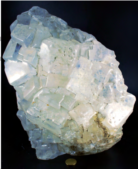
Halite (salgemma) provenienza miniera Pasquasia (Enna) – Museo di mineralogia, petrografia e vulcanologia Università di Catania