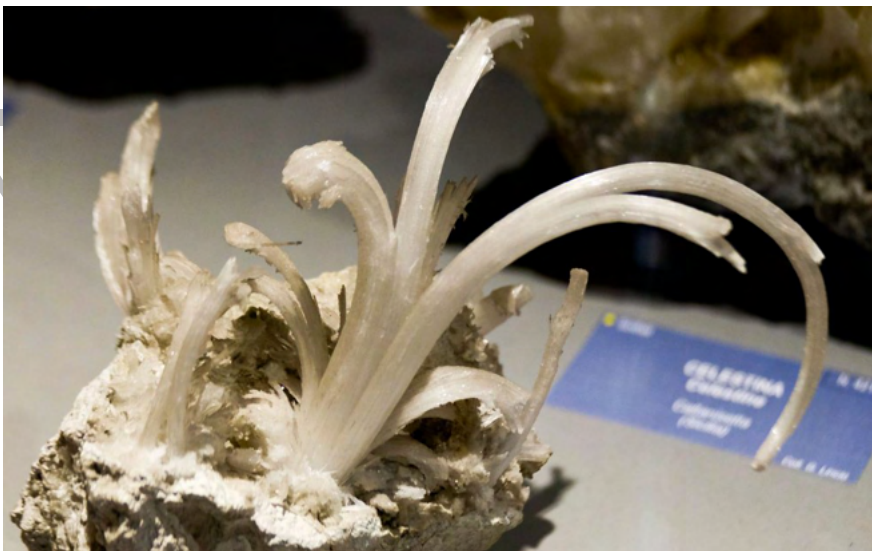
Gesso coralloide. Cetine di Cotorniano. Museo Civico di Storia Naturale G. Doria