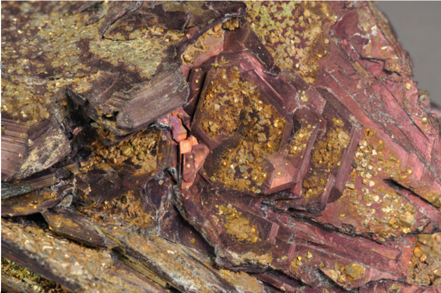
Covellite, Miniera di Calabona, Alghero (Sassari). Museo di Storia Naturale dell'Università di Pisa