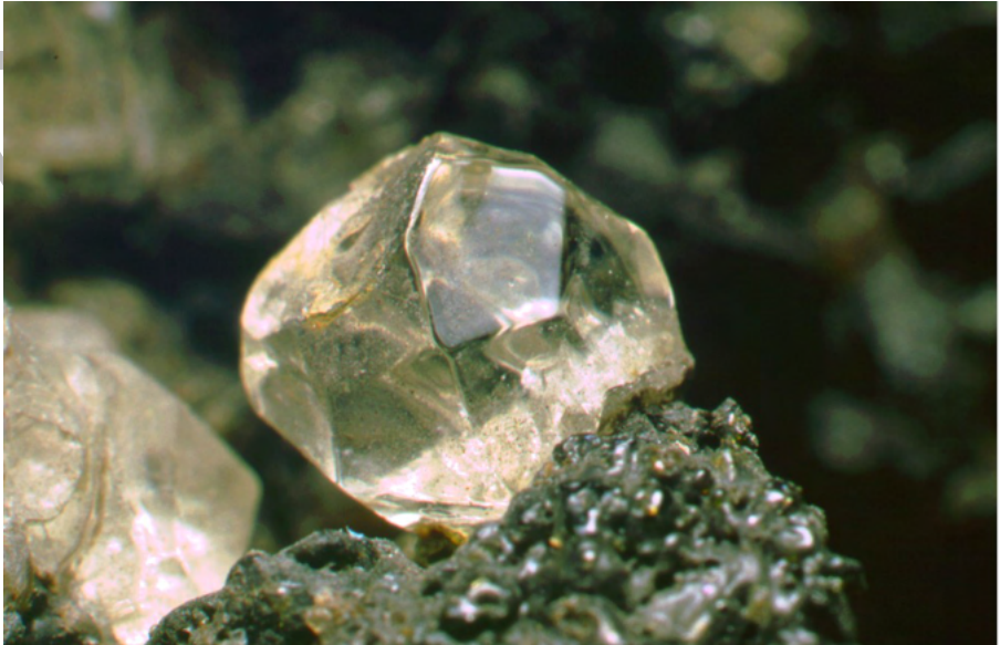
Leucite, Somma Vesuvio, Real Museo Mineralogico - Università FEDERICO II di Napoli