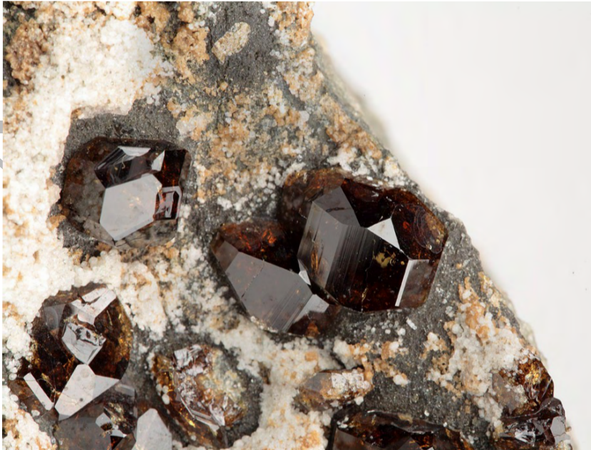
Vesuvianite, Somma-Vesuvio. Real Museo Mineralogica, Università FEDERICO II di Napoli