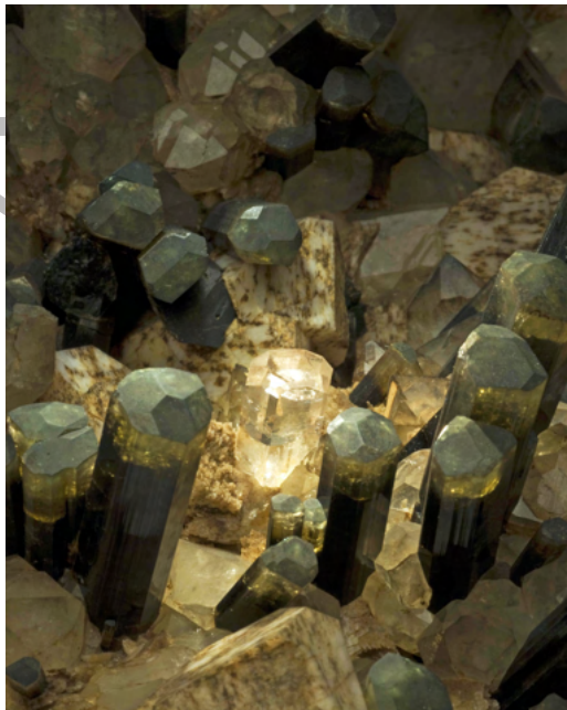
Tormalina e berillo su ortoclasio, quarzo e albite. Grotta d'Oggi, S. Piero, Elba. Museo "La Specola" - Sistema Museale, Università di Firenze