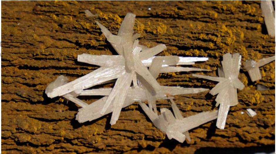
Cerussite su limonite stalattitica. Miniera di Montevecchio, Sardegna. Museo di Storia Naturale Giacomo Doria, Genova