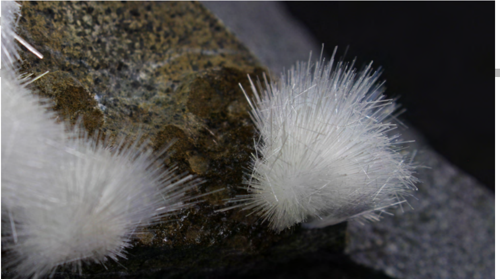
Natrolite, Mti Lessini-Gambellara. Museo delle Collezioni Mineralogiche, Dipartimento di Scienze della Terra. Università degli Studi di Milano