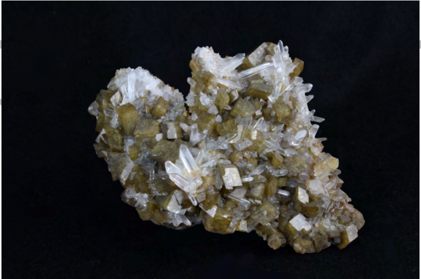
Siderite e quarzo, Allevard, Isere (France) Museo delle Collezioni Mineralogiche, Dipartimento di Scienze della Terra, Università degli Studi di Milano