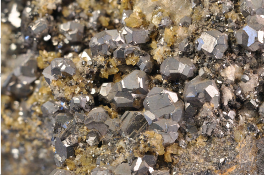
Galena su carbonati e quarzo, Miniera del Bottino, Alpi Apuane. Museo di Storia Naturale dell'Università di Pisa