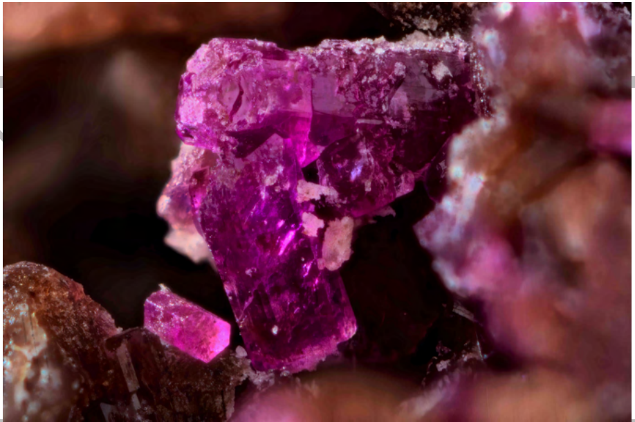
Aluminosugilite Miniera di Cerchiara (Borghetto Vara, La Spezia) Coll. D. Belmonte